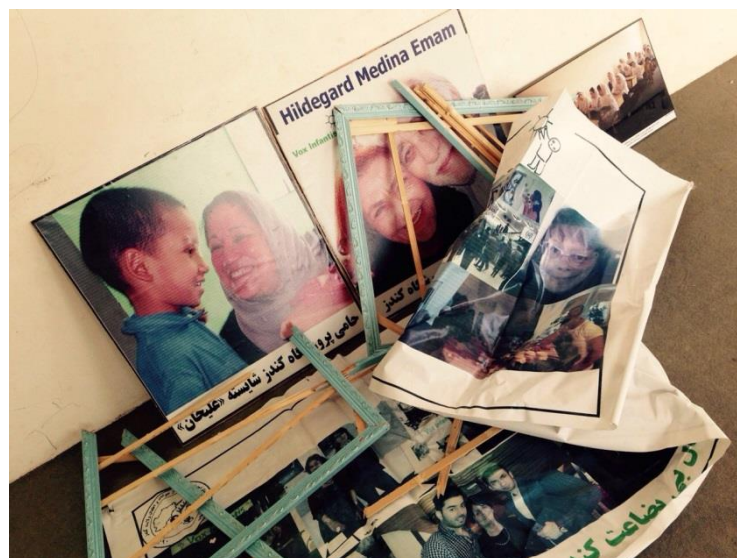
Une des actions de destruction par les talibans

d'ordinateurs, pour la Journée Internationale de la Paix le 21 septembre, pour la réouverture après l'occupation par les talibans en octobre, pour la journée de remerciements aux professeurs et pour la clôture de l'année scolaire en décembre.