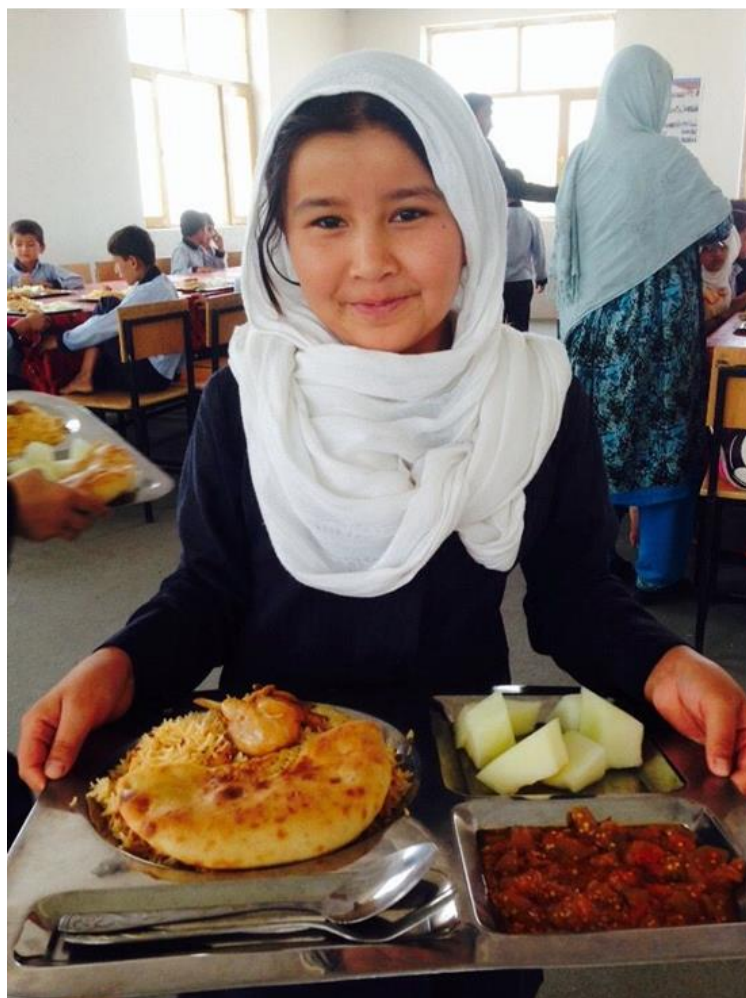
Le repas de midi, bien équilibré, avec de la viande, des légumes, du riz, du pain et des fruits

Le poste de la nourriture pour les enfants est le plus important dans notre budget. Nos recherches de parrains et marraines ont été récompensées. Actuellement, le poste nourriture bénéficie de 12 parrainages ce qui représente un total de CHF 11'750 . Mais il y a 70 enfants à nourrir ! D'autres parrains ou marraines seraient les bienvenus !