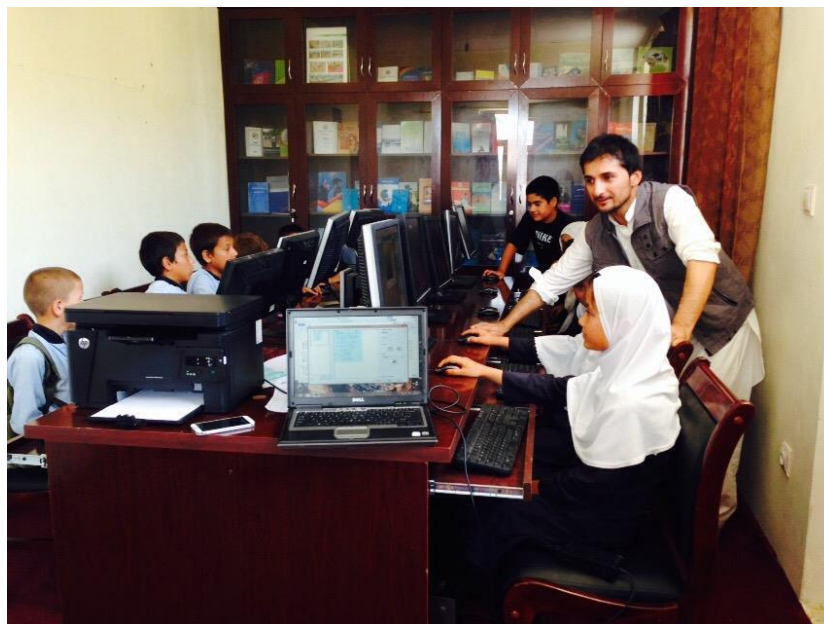
La classe d'informatique et la bibliothèque, installées en juin 2015

Nous avons transformé le local de stockage en bibliothèque et salle de classe pour l'informatique.